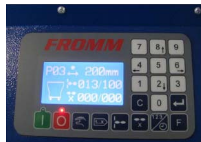
Painel de controle fácil de operar